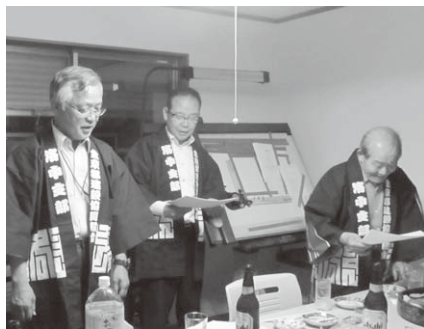
木遣唄の練習風景

ていることも率直に出し合う——それぞれの個性がいい味を出して会議そのものが楽しくなります。時には意見の相違も出ますが、日常の仕事のことや趣味の話にまで至り和やかです。その延長で始めたのが、「木遣(きやり)」の稽古。毎週木曜日に有志が集まって練習しており、揃いの法被も作って、組合員新年会でも披露しました。これは仕事での横のつながりにも発展しています。組合の行事にも前向きに取り組む「努力」をします。