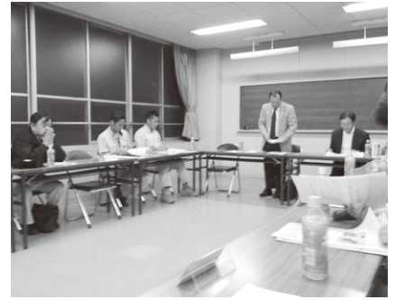
な支部長会議となりました。

講演後、各支部長から「組合に対する意見・要望・提案」の聞き取りを行い、さまざまな意見が出されました。これからの協同組合を考える上でも有意義