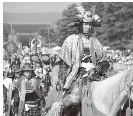
行列の先頭が通ってから、最後尾まで2時間