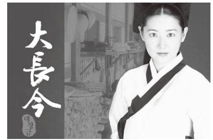
宮廷女官チャングムの誓い

同じ俳優さんを応援している30歳代の友人のご主人は、彼女がドラマを見ていたら、平気でプチッと切るそうです。残念です。こんな人にこそ見てほしいなあ。その点私は本