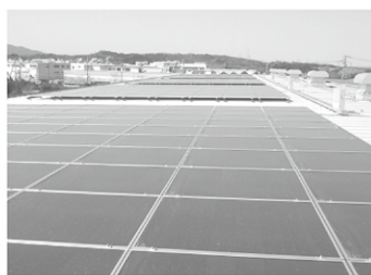
滋賀県 水口工業団地 Y製作所様