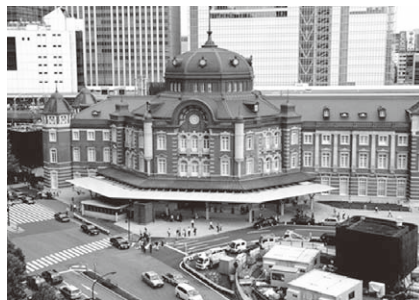
復刻された東京駅舎

災し避難した市民の50%が「帰りたくない」という判断をし、復興が危ぶまれている地区です。そんな地区に雄勝硯生産販売協同組合のプレハブの事務所はポツンと建っていました。