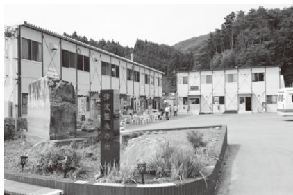
奥が雄勝硯生産販売協同組合の事務所。津波の被害で周りに建物は無い

先月号にも書きましたが、9月に宮城県石巻市へボランティアに行きました。その際、市の被災状況を知るためのフィールドワークで、雄勝地区(旧雄勝町)を訪れました。同地区は、被