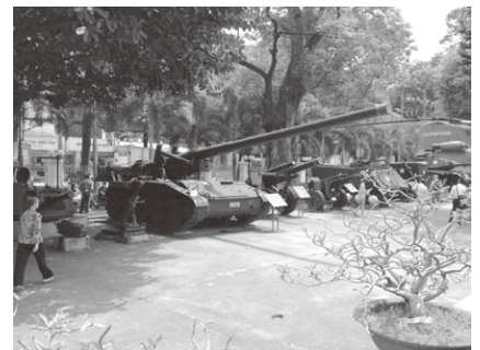
戦争証跡博物館 (ベトナム)

とにかく若い人が多く、活気にあふれ、これからますます発展していく国だということを滞在中に強く感じまし