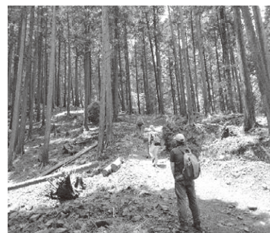
比叡山の険しい山道