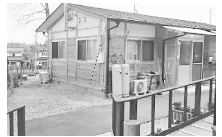
福島県の木造仮設