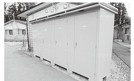
追加設置された収納庫