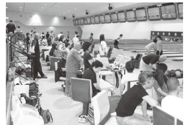
たくさんの参加者で盛大に行われました