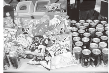
山盛りのストライク賞