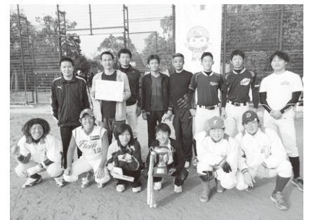
選手と記念写真 (JICチーム)