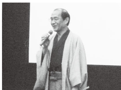
挨拶する門川市長