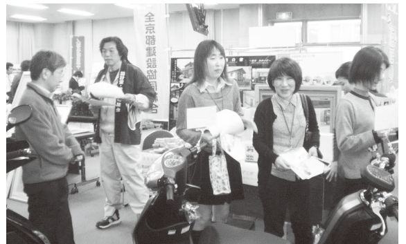
新規顧客獲得へ向けて、ラストスパート