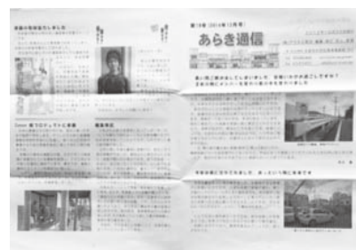
19号になった『あらし通信』