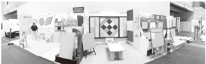
5社分のスペースを活用した展示(中信ビジネスフェア)