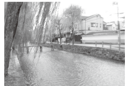
白川沿いの街並み