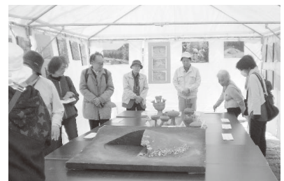
古墳の模型と出土品の展示