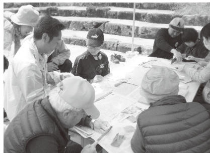
NPO法人もっこの会のメンバーが勾玉づくりのお手伝い

のある一般人、更には学生などの若者にもっと広げるような宣伝活動を保存会、文化財行政と共に取り組みたいと思います。(山本敬三)