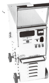
高効率バッテリー発電機 (上の箱が発電機、下の箱がバッテリー)

バッテリーの充電時間は4～6時間で、深夜電力で充電すれば電気料金の軽減にもなります。移動式なので、災害による停電などの緊急時の照明、送電線のない場所での照明、夜間作業やトンネル工事での照明から、パソコンの充電など各種電源までの広い分野で使えます。