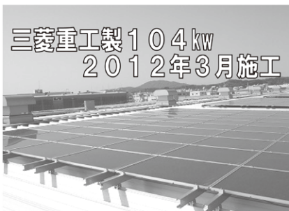
三菱重工製104kw 2012年3月施工