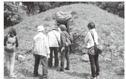
14号墳 古代への入り口