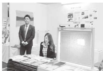
省エネに力入れる都テント工業