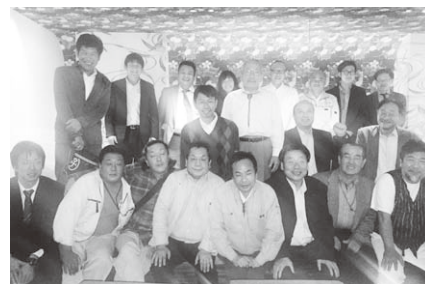
参加者全員で(前列右端が越前屋さん)