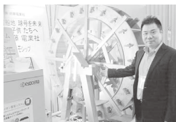
水車を見せる近藤電業社