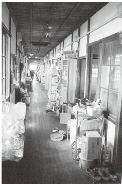
吉田寮の“歴史”ある廊下

吉田寮での暮らしで、疲弊していった夫とは裏腹に、私は多くを得ました。これまでずっと疑問に感じていた暮らしのあり方について、次々に解けていくのが快感でした。