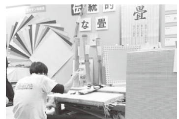
一家1和室を提唱する?にしむら