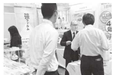
遮熱・断熱の那須産業