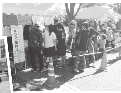
▲ブースには沢山のお客さんが