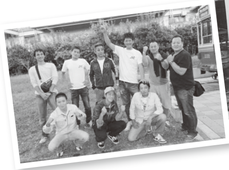
▲みんなで記念撮影