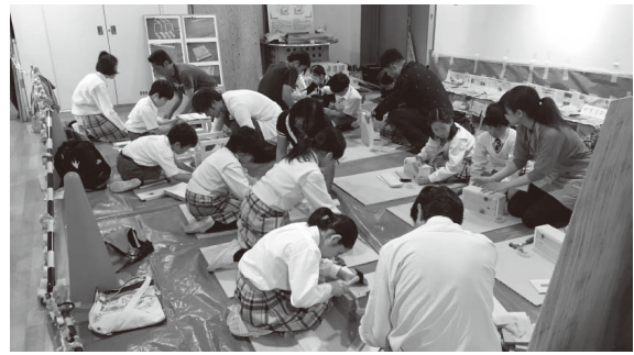
立命館小学校での出前授業の様子

そのお話を聞いて感じたのは、昨今、建築現場の内部を見る機会が減ったなということです。安全対策の強化に伴い、頑丈なフェンスや足場、養生シート、万能塀で囲まれ、大工仕事や、設備屋さん、電気工事屋さん、その他様々な仕事ぶりを見る機会が減ったなと感じました。私は40代半ばの世代なので、少年時代にはまだまだ建築現場をたくさん見る機会があったと思います。