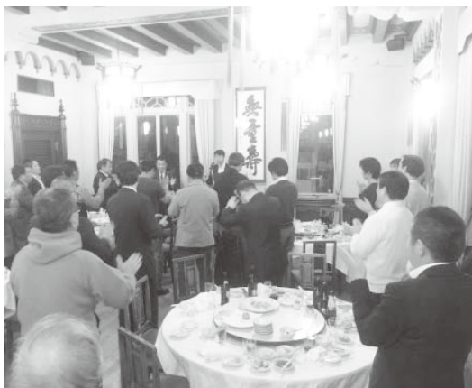
(左)挨拶する宮下副理事長。