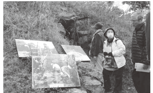
古墳の整備事業予算なども