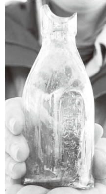
明治時代の牛乳瓶