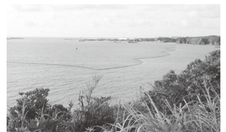
大浦湾に浮かぶ工事海域を示すブイ