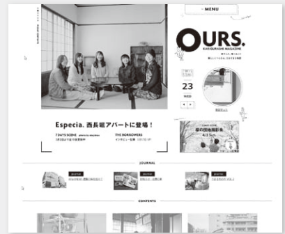
サイトのトップページ