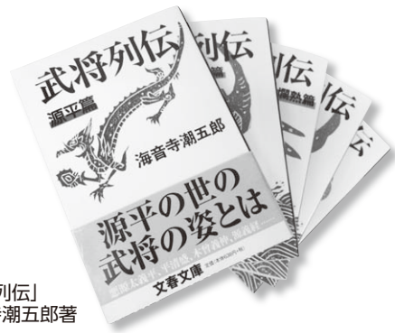
「武将列伝」 海音寺潮五郎著

では「史伝文学」とはどのようなものなのでしょう。 「史伝文学とは、歴史上の人物や事件を対象とした文学作品。物語風にかかれたとしても、フィクションの要素を完全に排除し、広範かつ詳細な文献調査などをもとにして、歴史の真実はどのようであったかを明らかにしようとする形態の書物」を指します。簡単に言えば想像やつくられた史実ではないということです。