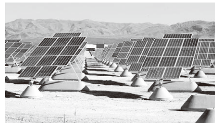
ゴビ砂漠のメガソーラー施設

で、「コストの急減と、国内での電力生産のメリットが輸入電力への依存を上回ったことが要因である」と報告書では分析されています。再生可能エネルギーが従来型のエネルギーを上回ったという事実は「構造改革が進んでいる」ことを示しています。(西村 学)