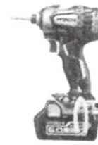
アクティブイエロー (Y)