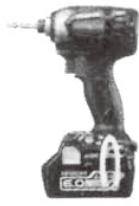
ストロングブラック (B)