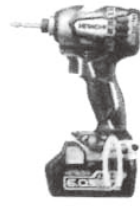
スピーディーホワイト (S)