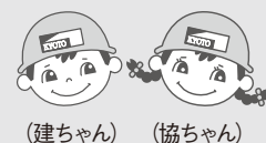
(建ちゃん) (協ちゃん)

ただいま組合では熊本地震で被災された方々への義援金を募っています。賛同いただける方は下記の口座へお振込みください。いただいた義援金は熊本県へお届けします。