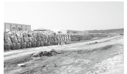
フレコンバックに詰められた汚染廃棄物が山積みになっている(2015年福島県富岡町)