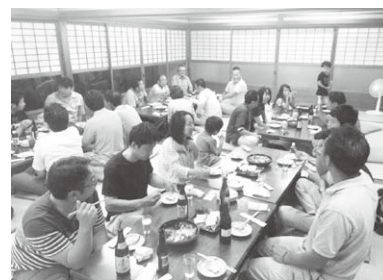
親睦会で交流を深めました