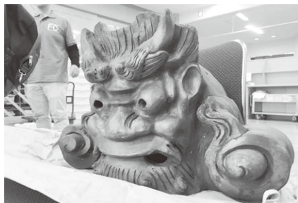
見本で展示した鬼瓦