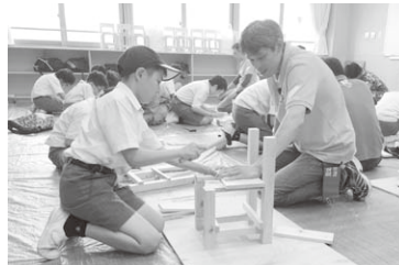
真剣に金槌を振るう子ども達

た鬼瓦を」という光本支部長の思いは子ども達に伝わったはず。木工体験では、大人と一緒に金槌と釘で木工に取り組む子ども達の姿は真剣そのものでした。