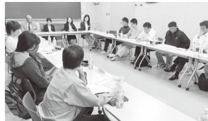
保険セミナーの様子

ク」と題して、自然災害や盗難などの損害・賠償リスクについて説明を受けました。(西村 学)