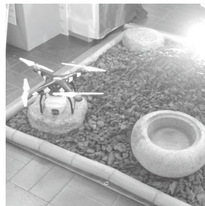
最近話題のドローンも

見学者にはインパクトを与えてビジネスになれる確信は持てました。ほかに最近関心のあるドローンはスカイロボット、災害時に必ず必要な兵庫県警の作成したライフジャケット、パナソニックの導光板形LED照明、これからの照明業界の先取りとなります。さらに廃油回収機器