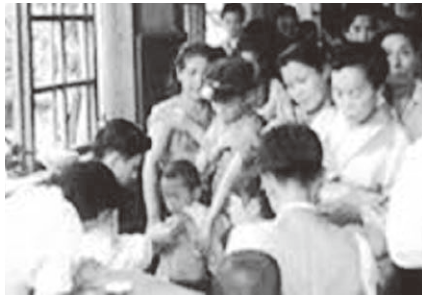
現在、推定されるB型肝炎ウイルス持続感染者数は、110～140万人。このうち、昭和23～63年に受けた集団予防接種等で“使いまわされた注射器”による持続感染者は、最大で40万人以上とされています。

Q 病院で検査したところ、B型肝炎ウイルスに感染し、肝がんであることが判明しました。このような場合に、給付金が支給されると聞いたことがあります。どう対応したら良いのでしょうか？