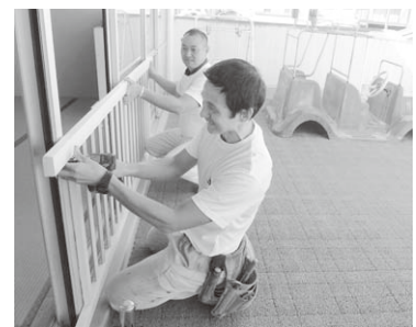
木製の安全柵を設置する築山会長(手前)