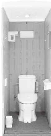
フラワートイレ (日野興業(株))

2012年現在の建設現場で働く女性の割合3%を19年までに倍増させる計画です。しかし建設現場のトイレは、和式が中心で女性に敬遠されてきました。そして、災害時に避難所で設置される仮設トイレも和式がほとんど。女性だけでなく、足腰が弱い高齢者や和式に慣れない子どもたちから「使いづらい」と問題視されてきました。