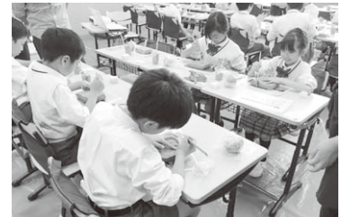
思い思いの鬼瓦をつくる子ども達