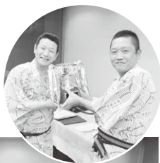
和やかな雰囲気での宴会