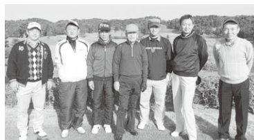
晴天の下で記念撮影(2日目)

珍プレー続出。宴会ではざっくばらんな表彰式でプレミアムな賞品の授与がされました。