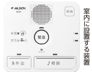
室内に設置する装置