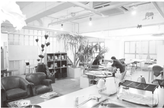
京都のコワーキングスペース