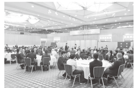
会場には148人が集いました

一昨年より若い組合員が増えました。昨年度加入の19人の組合員は30代、40代が大半です。岩井新理事長も41歳と若く、意気揚々と新年を向かえました。昨年は不景気な話が出ましたが、組合288企業で、今年