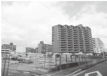
住民の高齢化と建物の老朽化が一斉に進む京都市内のマンション

建設工事業部では、今年度も京都市内の高経年マンションの改修工事を受注するために管理組合の理事長への営業訪問を続けています。その中で、