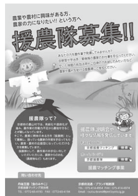
隊員募集のチラシ(京都府)

そこで、京都府では株式会社丹後王国と連携し、農業に興味のある方、農業者の力になりたいという方を「援農隊」として募集・登録し、人手を必要とする農業者とマッチングさせる取組みを行っています。