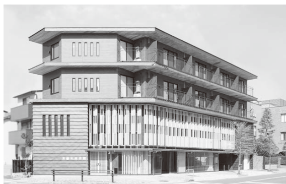
構造材に100%府内産材を用いた京都木材会館（中京区）

国産CLT普及へ動きだしている中で、政府には慎重な対応が求められます。（編集部）