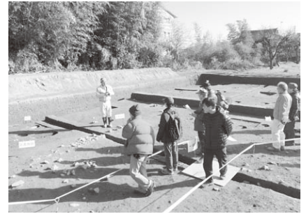
現場説明会の様子(向日市)

ものまで全部で数万カ所、一県で数万カ所もあり、自分たちが住んでいる市町村にも必ず数カ所の「城」があるそうです。いつも観ているあの山が、あるいはあの丘あの森が、城だったかもしれないというわけですね。教科書に載っているような大きなお城を築いたのは実は歴史上少数で、ほとんどは小さな砦のような城だったようです。そんな誰も知らない小さな城を私たちが知ることは、歴史上に名が挙がることのない城主たちにとって嬉しいことなのかもしれませんね。(門田元気)