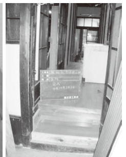
町家のバリアフリー化事例