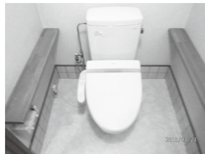
トイレ床段差解消事例