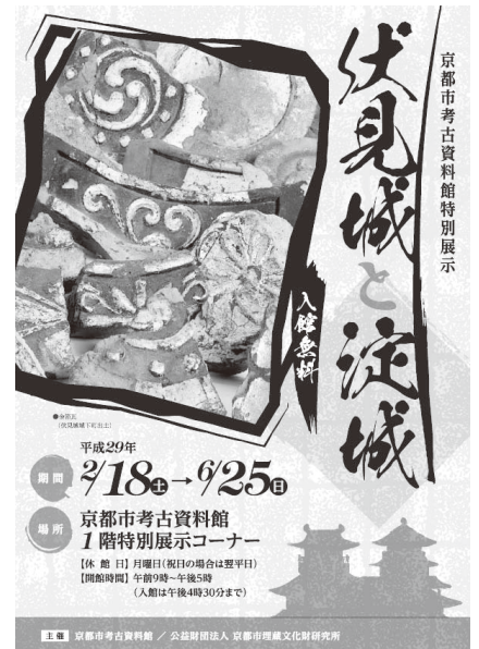
「伏見城と淀城」チラシ (京都市考古資料館)