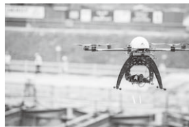
建設現場での普及が進むドローン