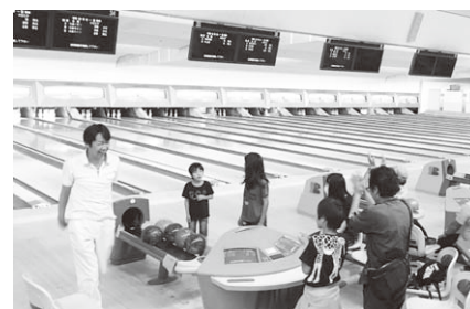
毎年恒例の右京ボウリング大会

りある議論ができた」「こうした支部長会議ならどんどん参加したい」という意見が聞かれました。支部長の交流・懇親も含めた議論をこれからも継続していきます。