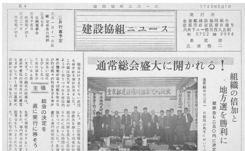
現存する最古の建設協組ニュース(No.4 1963年3月1日発行)

当時から「組織の倍化」と組合員拡大が叫ばれていました。総会での質問なども詳細に掲載されています。