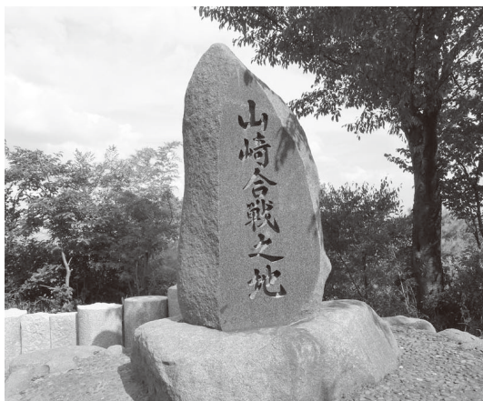
天王山の八合目に立つ「山崎合戦之地」の石碑

まさに天下をかけての戦は天王山を制する戦いでもあったことから、「天下分け目の天王山」と言われるようになったわけです。ちなみに、天王山は山崎の戦いだけではなく、南北朝時代の戦いや応仁の乱なんかでも、戦の要の地ともなっています。それほど、重要な地であり、結果を出す重要な局面でもあったということが考えられます。(門田元気)