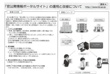
官公需情報ポータルサイトを説明した資料