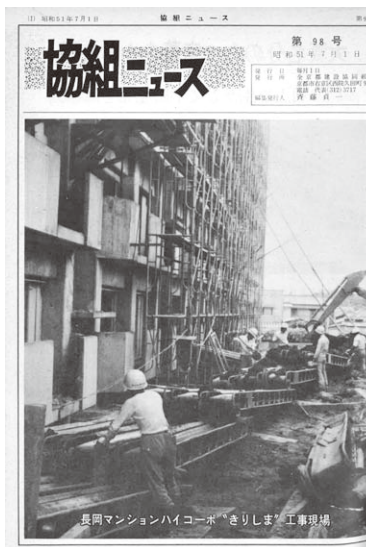
現場の写真も登場