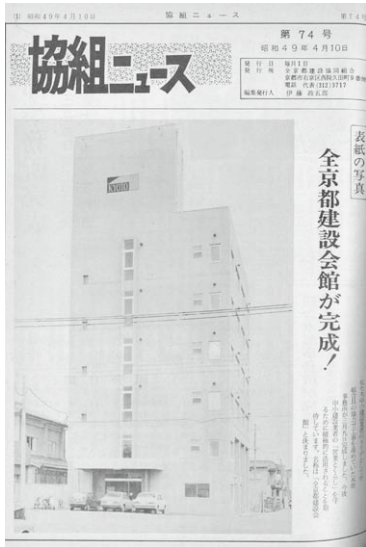
全京都建設会館完成