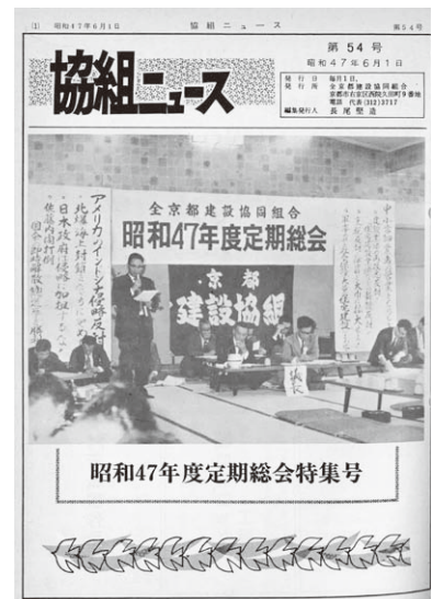
昭和47年度定期総会