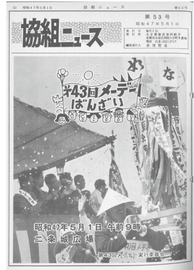
さまざまな活動が表紙をかざりました