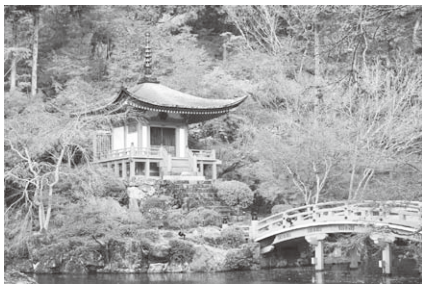
醍醐寺の弁天堂の紅葉

もみじを詠んだ歌が多く残っているように、桜ほどではなくとも昔から存在していることがわかります。