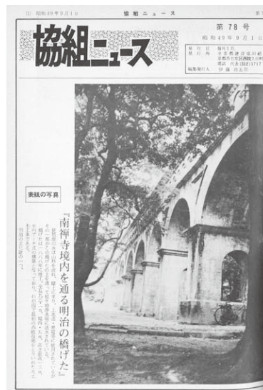
文化財シリーズも人気を集めました