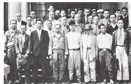
「協同」の理念に組合員が集った 1955年の発会式(京都府庁)

地元の中小企業を守るという目的に立ち返ること、互いが互いにとっての利益を地道に考えることこそが社会をより良くしていく確かな原動力なのではないでしょうか。(編集部)