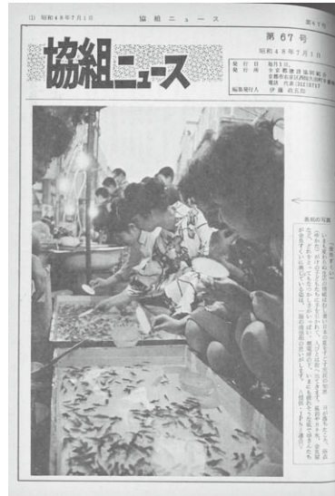
子どもも多く登場しました