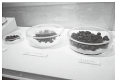
縄文時代晩期の保存食用の木の実

会場には、旧石器時代に生息していた大型哺乳類の足跡(岡崎遺跡)をはじめ、これまでに9基の方墳が判明した吉田二本松古墳群の資料など、興味深い展示が次つぎと。また、洪水などの影響で湿地化した場所に、トチの実やドングリなどを保存食とするために掘られた穴や、そこか