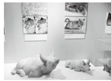
「企画陳列」の牛の大型土製品

また、会場入り口には「企画陳列」として、発掘調査で出土した牛の大型土製品が並べら