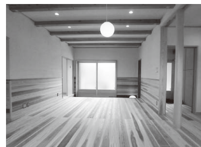
土間へと繋がる広々としたリビング