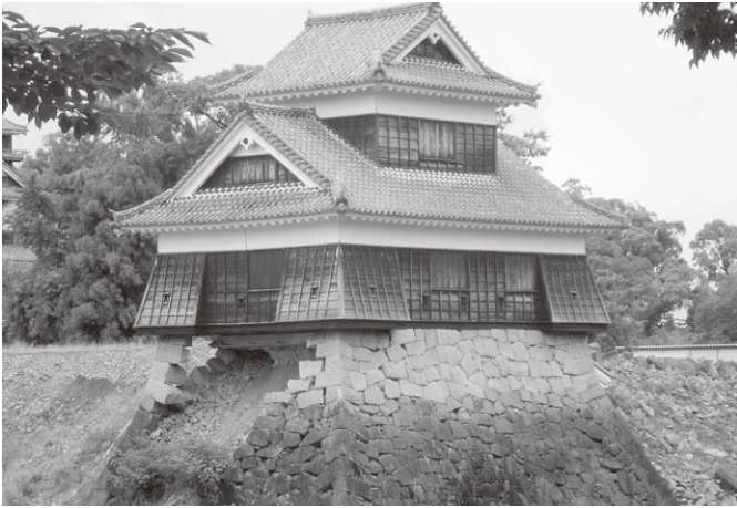
絶妙のバランス コーナーの石だけで支えられたやぐら(櫓)