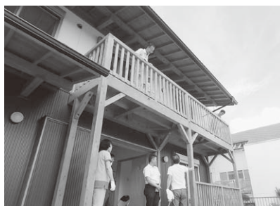
見学者を案内、説明

住み始められた御施主様に感想をお聞きしたところ、「以前の家より涼しく、断熱性能が良く、家事動線も設計士さんによく考えていただき、住み心地、使い勝手の良さを実感している。訪ねてくるお友達が、デザインがお洒落で、カフェに来たみたいと褒めてくれます」とのこと。楽しい会話が弾む、愉快的暮らしが始まります。