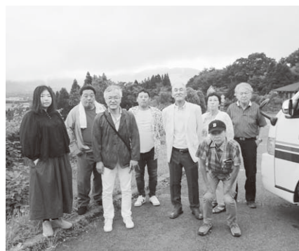
阿蘇の外輪山を臨む展望台

7月2日は湯布院から熊本城へ。阿蘇山の雄大な風景を見ながらのドライブです。普段京都でみるよりも空がずっと大きくて視界の3分の2が空でした。現地のボランティアガイドさんに案内されて地震に遭った熊本城を見学してまわりました。崩れたお城、塀、