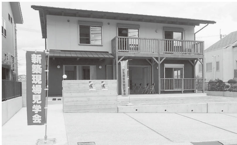
完成見学会 建物全景