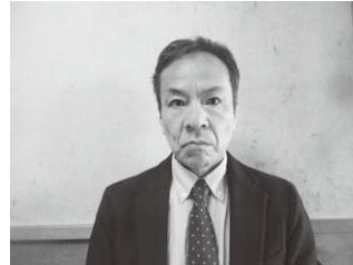
今の私、ランニングは続けています