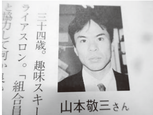
26年前入組頃の私、趣味はスキー、トライアスロン

私ごとですが、この3月が60歳定年退職の時期です。26年を振り返って別段何かを達成したとかの実感は無いですが、営業職がほとんどで、「しいて言えば自分自身営業向きなのかな」と最近思っています。新しい工事課の職員体制やマンション事業を柱とした新規事業の型が整うまで、嘱託職員としてお世話になることになりました。皆様何卒宜しく御願いたします。