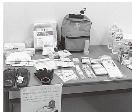
防災グッズの例(展示会)

また、受講後は記憶も残っておりませんが、日が経つと受講内容も薄れてしまうので、2年に1回は普通救命講習を受ける事が良いと消防局の方がおっしゃっていました。全ての講習を終え、最後は一人ひとりに修了証が発行されました。