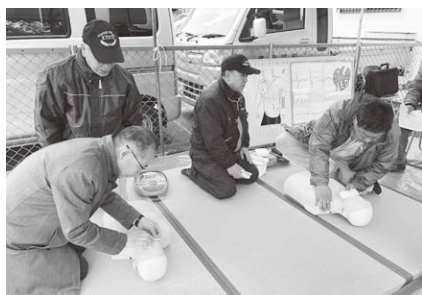
意識確認後に心肺蘇生法を実践

京都市消防局の一年間の救急出動件数は、約9万420件、この数字からも誰もが救急事故に遭遇する可能性があります。また、救急車が現場に到着するまでの時間は、全国平均8分以上かかります。その場にいる人が1秒でも早く、周囲の人と協力をして自分のできることを行動に移すことが、救命効果を高めていきます。