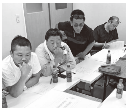
周年委員会の様子