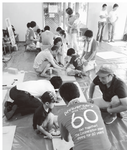
前回の建ちゃんまつりの様子