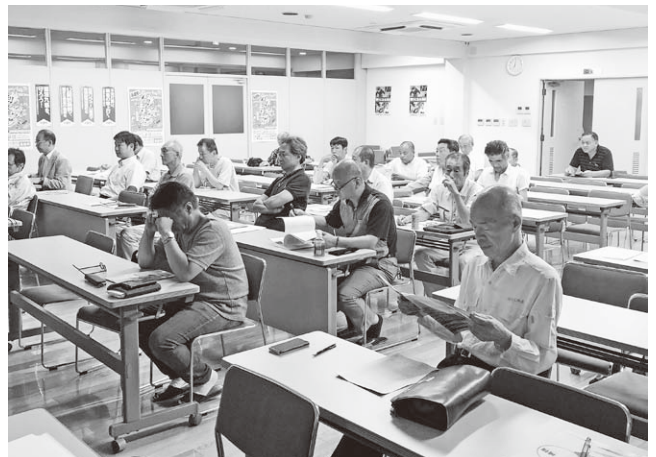
耐震補強工事 学習会の様子

現在、マンションにお住まいの組合員様並びに社員の皆様にもご協力をお願いして、この新しい柱を育てて頂きたいと思っております。皆さんのマンション管理組合の役員様の間では耐震化ということについて話は出ていない