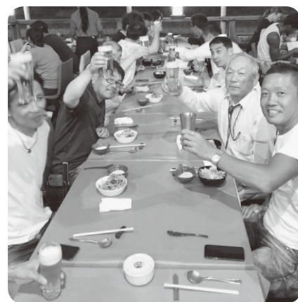
「岩焼ことし」さんでの納涼例会

参加したことがないという方も是非、これから一緒に作り上げていきましょう!!! お気軽にご参加お待ちしております☆