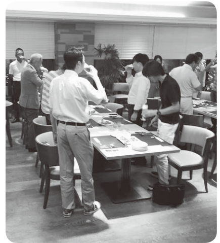
納涼例会 乾杯の様子

今さら出席しにくいと感じておられる方もいらっしゃると思いますが、支部の皆さままでお声掛けをしていただき出席しやすい環境作りもしていかなければと思っております。