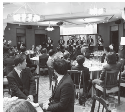
昨年の新年交流会の様子