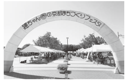
昨年の建ちゃんまつり

来年度に向けて計画をしていきたいと考えておりますので、開催の際はご協力の程よろしくお願い申し上げます。