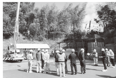
玉掛け講習の様子

吊り上げ荷重1トン未満のクレーンに玉掛けをする場合は玉掛け特別教育で問題ありませんが、吊り上げ荷重1トン以上のクレーンに玉掛けをする場合は国が認定する玉掛け技能講習を受講し、修了しなければなりません。