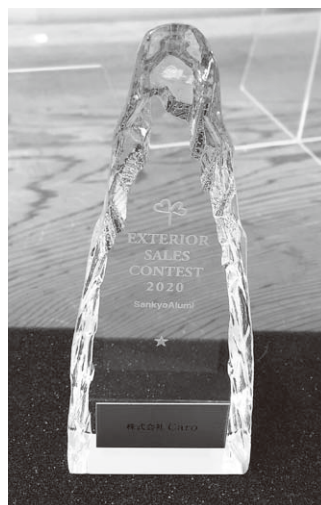
エクステリアコンテスト受賞