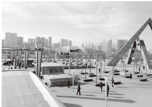
西寧駅前の街並み

到着後すぐにホテルに送迎され、まず行われたのは血中酸素飽和度と心拍数の測定でした。ツアーを通して、朝・夕に必ず行われる検査とのことで、高山病になっていないかを調べるためとのことでした。そして、これは渡航前から厳しく言い渡されていた事でしたが、『渡航後数日は一切の入浴禁止』の件を改めて念押しされました。低地から高地の移動で気圧が激変している状態で熱湯を浴びると、血管が破裂することがある…(ガイドの説明まま)という恐ろしい話に自分は縮み上ってしまい、当日はダイヤモンド(前回譚その1ご参照)を服用し、低酸素状態のぼんやりした心身を引きずりながら、コンタクトレンズを外して眼鏡ルックにチェンジし、眠りにつきました。