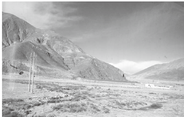
青蔵鉄道の車窓から

青蔵鉄道の道程の難所は、当日の真夜中に訪れました。人が長く生きられないと言われるほどの高地、中国政府が国を挙げて管轄する標高4500mオーバーの自然保護区『ココシリ自然保護区』を通過していた頃です。深夜にハッと目が覚めました。「なんか冷たいな…」と思ってよく見たら、水の入ったペットボトルの蓋を閉め損なったまま、意識を失ってベッドの上で頭から水浴びをしていたようでした。ふと胃がムカつくことに気が付き、寝台の最上段からヨタヨタと梯子をつたって降り、トイレに向かうとチベット人の仏僧