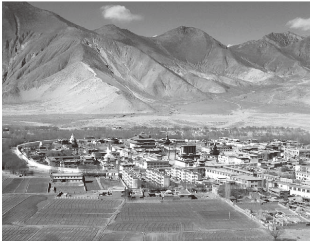
曼荼羅を模したサムイエ寺の全景

ところで、一概にチベット寺院では胸いっぱい芳醇なバターの香りを味わうことができます。境内には信者が持参した手製バターを差し入れる灯明があり、多くの信者が手作りバターを注ぎ込みます。また、バター製の彫像が飾られていることもあります。そのバター製の彫像は小さいものから、中に芯を入れた四方