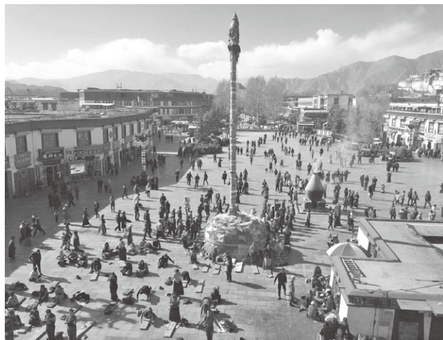
ジョカン寺門前で五体投地に勤しむ信者たち

ラサ到着後は、旧市街中心部にある『ジョカン寺』を訪れました。寺の門前広場で多くの信者が五体投地に勤しむ風景が印象的なお寺です。チベットを史上初