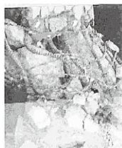
鉄筋コンクリート+SRF