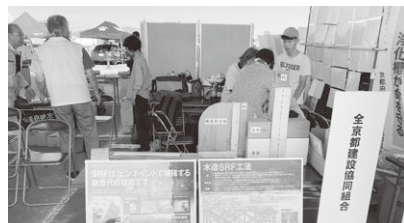
石山テクノ建設(株)