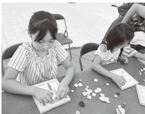
2019年度建ちゃんまつりの様子