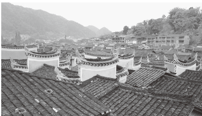
薄い瓦が山積み伝統建築群