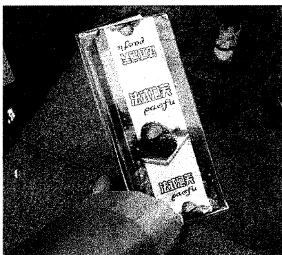
法式=フランス式、泡芙=シュークリーム