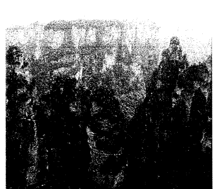
画角に納まってくれないでっかい武陵源