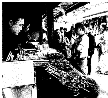
山頂で食べる屋台の串焼きブライスレス