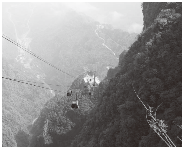
森林公園の入り口から一気に高所に上がるロープウェイ

でタクシーに乗って張家界国家森林公園に向かいました。この時お世話になったガイドさんは私専用のガイドさんだったのと、事前にかかるコストを最大限に抑えたので、タクシー代やバス代などの交通費、食事代はガイドさんの分も含め私が現地で支払う約束になっていました。というわけでタクシーの運賃を払おうと端額の1元を小銭で出したら運転手が受け取ってくれず、困惑していたところガイドさんが「この辺ではコイン使えないですよ。だから受け取ってくれない」と教えてくれました。え!! そんなことあるの!? と驚きでしたが、この後日に行った鳳凰古城では小銭が使えたのだから中国は不思議な国です。