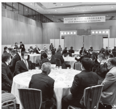
新年組合員交流会の様子

2023年1月20日(金)にグランヴィア京都にて3年ぶりとなる新年組合員交流会を開催いたしました。組合員72名の参加でとても多くの方にご参加をいただき、組合員の皆様とともに新年をお祝いできたこと、とても嬉しく思っております。