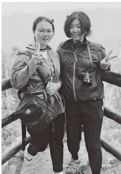
同世代の現地女子ガイドと2人旅

自分史上“最軽量”の旅行手荷物の内訳は、下着1式、Tシャツ1枚、羽織1枚、靴下1足、スマホ、一眼レフ、充電器、Wi-Fiルーター、タブレット、現金、クレジットカード、パスポート、水筒用のペットボトル、でした。わざわざこのために厳選した乾きやすい素材のシャツ・ズボンの一着は毎晩ホテルで手洗いして間に合わせました。荷物が少ないので貴重品の管理も簡単だし、良いことづくめでした。