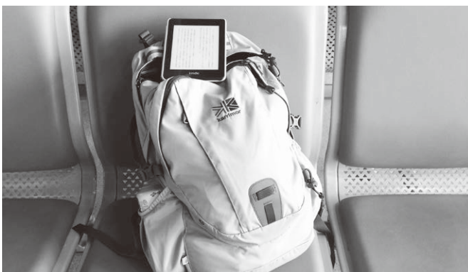
リュックサック1つで初海外 身軽すぎて不安