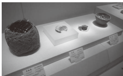
約2800年前のパンケーキ