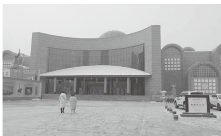
新疆ウイグル自治区博物館