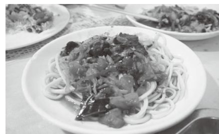
お野菜とお肉の混ぜ麺「ラグマン」