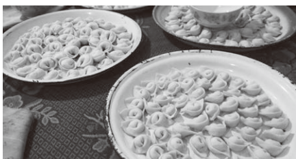
餃子とワンタンを足して2で割ったような…餃子