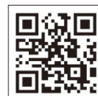
GビズID発行はこちら