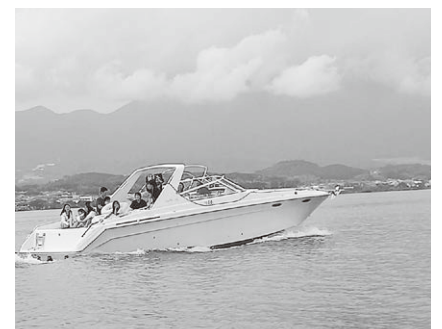
クルージングの様子

バーベキューも含めて野外で開放的な気分で過ごすことができ、3年前よりも多くの方に参加をいただけてコロナ前の活気が戻ってきたように感じました。今後も新桂川支部ならではの企画を考えていきたいと思いますので、その際は皆さまのご参加お待ちしております！