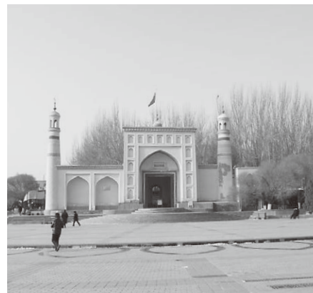
ウイグル最大規模のモスク 「エイティガール寺院」前景