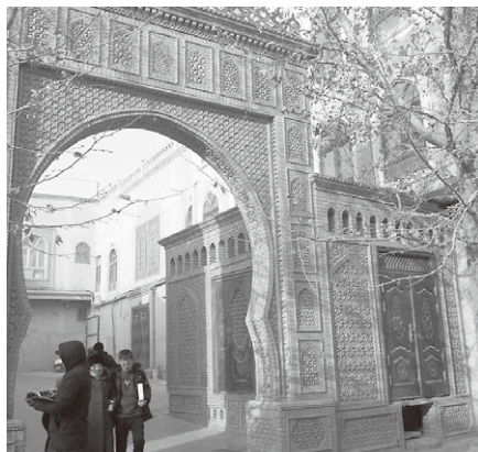
お仕上げばっちりて生活感の乏しい カシュガル古城内