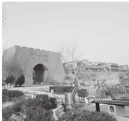
カシュガル古城の入口 テーマパーク化された旧市街