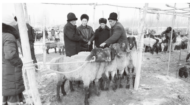
首まわりを数珠つなぎにされている羊たち

まず向かったのは大きな家畜市場でした。“鈴なり”の羊や山羊(掲載写真ご参照)、そして牛がだだっ広い砂地にひしめき合う中、もこもこの帽子をかぶった現地の人達が家畜の売買に集っていました。羊・山羊のいるエリアには入らせてもらえたものの、牛の繋がれているエリアには当局警察の制止で入場を許してもらえませんでした。危険だから、というのがその理由とのことでしたが、観光客に見せられる範疇を超えているというのが理由だったのではと思います。