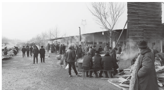
大賑わいの家畜市場そばの屋台コーナー

今まさに競売にかけられている家畜群のすぐ脇では、バッサバサと捌かれた大量の家畜が血みどろ剥き出し状態で吊るされ、一方ではこんがり焼かれ、売られていました。(写真は流石に自粛)内陸の遊牧の民は、やはりゴリゴリの肉食文化をお持ちなんだなあ～と思いつつ、こんな光景を見ながら競売にかけられる家畜