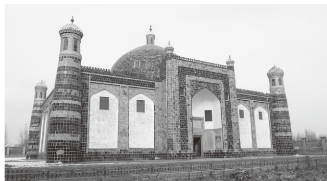
夕暮れ間近の香妃墓

の気持ちは如何ばかりか…と眺めていたら、搬入されてくる羊に首輪から全力で抜け出そうとしつつ盛大に失禁している子がいました。大変生々しいワンシーンでした。そんな情景を横目に食べる羊肉の串焼きと肉餡の焼饅頭、小籠包はこれまた肉々しく、ワイルドなお味がしました。