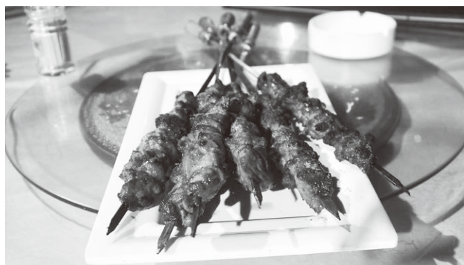
イスラム文化圏の新鮮な羊だからか…美味すぎる羊肉の串焼き