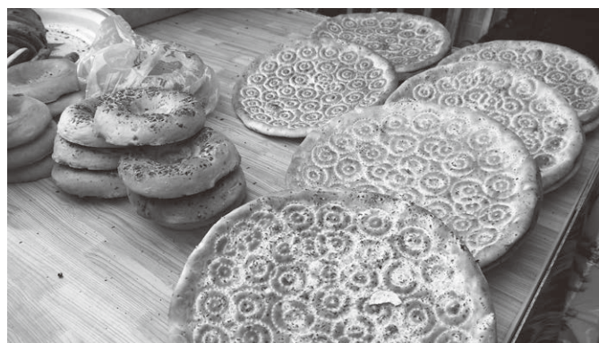
中央アジア感が強いナン(食感は軽め)