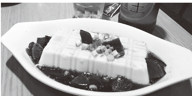
無事の到着を祝してピータンてんこ盛り冷奴