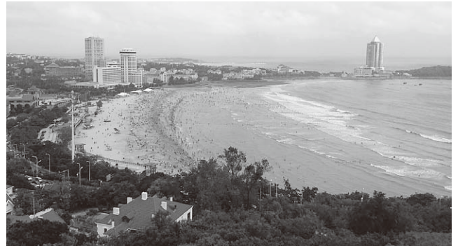
すさまじい暴風の最中でも盛況のビーチ

当時、2018年のお盆休暇を渡航日に当てることは先に確定していたので、まず関西国際空港が公開しているフライトスケジュールを閲覧しました。フライトスケジュールというのは航空路線の時刻表のようなもので、いつ・どこへ・どの航空会社が便を飛ばしているのかを確認できる代物です。関空を離陸する時刻に無理がなく、現地到着時刻にも無理がない渡航先を旅行日程と照らし合わせてみると、『青島』が渡航先に適しているらしいことが分かりました。渡航先を選別できれば、今度はその航空便を運営している航空会社が特定できます。日本で有名な航空会社といえばJAL・ANAですが、諸外国の航空会社もそれぞれアルファベット表記の略称を有しています。海外の航空会社の略称に明るくなくても、インターネットで検索すればすぐに特定できます。航空会社が特定できて、その航空会社のホームページから直に航空券を購入することが出来ればしめたものです。当時の私もこの手